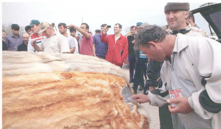
Taus Makhacheva "The Fast and the Furious," (2011) (video still 2) HD video, 26.06min,sec long