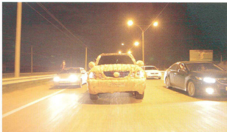
Taus Makhacheva "The Fast and the Furious," (2011) (video still 1) HD video, 26.06min,sec long