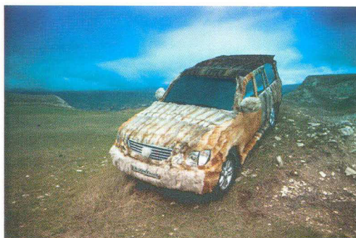
Taus Makhacheva "Untitled" from the series "The Fast and the Furious," no 3 (2011) C-print, 56x85 cm, edition of 6