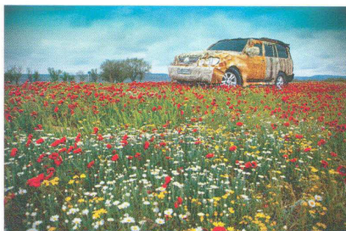
Taus Makhacheva "Untitled" from the series "The Fast and the Furious," no 2 (2011) C-print, 56x85 cm, edition of 6